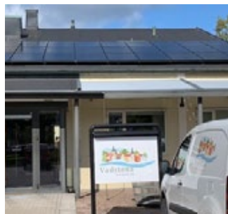
Solceller monterade på kontorstaket